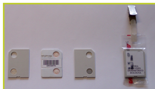
Dosimetro per neutroni termici