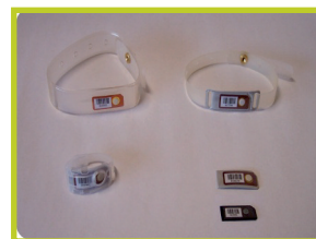
Dosimetri per estremità