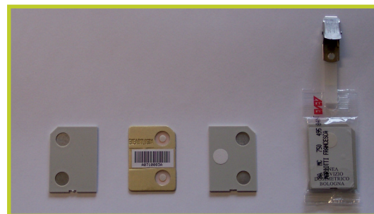
Dosimetro per fotoni

Immagine dei diversi tipi di dosimetri e loro componenti: