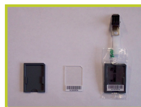
Dosimetro neutroni veloci