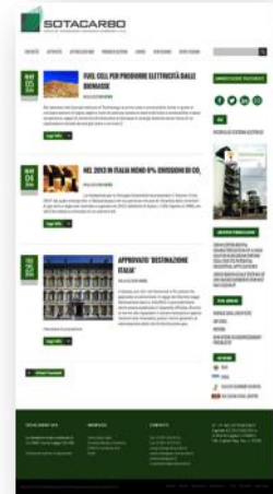
Figura 1: Homepage Sotacarbo.it