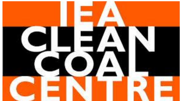
Figura 1: Logo IEA CCC