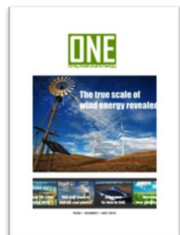
Figura 2: Bozza copertina ONE (Only Natural Energy)