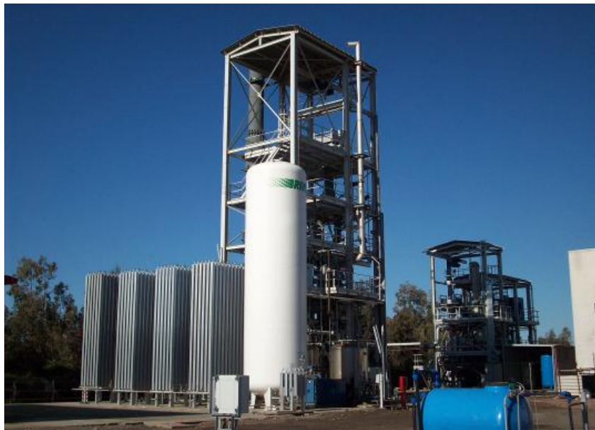
Figura 1.1. La piattaforma pilota Sotacarbo.

Nell'ambito delle attività di ricerca per lo sviluppo di un processo di gassificazione del carbone e trattamento del syngas per una produzione di idrogeno ed energia elettrica a emissioni estremamente ridotte di agenti inquinanti e di anidride carbonica, Sotacarbo ha recentemente sviluppato una piattaforma pilota (figura 1.1) comprendente due impianti di gassificazione in letto fisso up-draft (tecnologia Wellman-Galusha) e una linea per la depurazione e lo sfruttamento energetico del syngas.