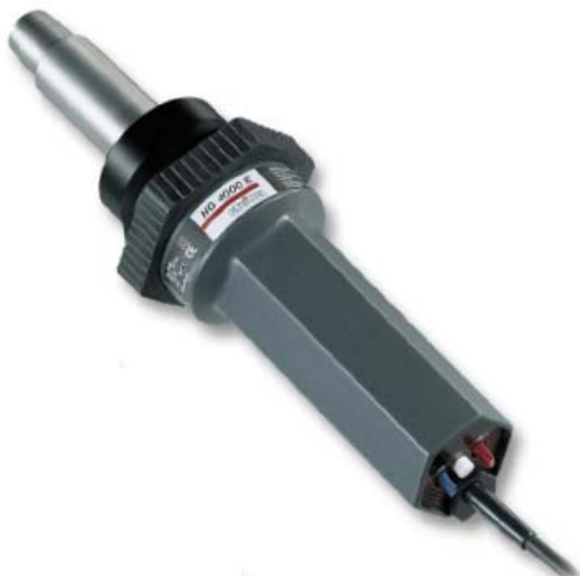
Figura 4-3 – Generatore di aria calda utilizzato per fornire energia termica alla sezione di prova

Per produrre aria calda a temperatura e portata volumetrica controllata, si utilizza un generatore d’aria calda per uso industriale (Steinel HG 4000 E), mostrato nella figura seguente.