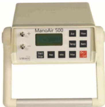
Figura 4-1 –Misuratore di pressione differenziale tra le sezioni di ingresso e uscita dell’aria

La superficie esterna del tubo centrale è coibentata con uno spessore di circa 60 mm di lana di vetro per alta temperatura (fino a 600 °C ), per ridurre le perdite di energia termica verso l’ambiente esterno. Sulla superficie esterna della coibentazione è avvolto un nastro di alluminio che oltre ad avere la funzione di contenimento della lana di vetro, riduce ulteriormente lo scambio termico verso l’ambiente. Nella figura seguente è mostrato il layout della sezione di prova.