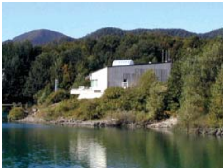
Veduta esterna del Centro Informazione