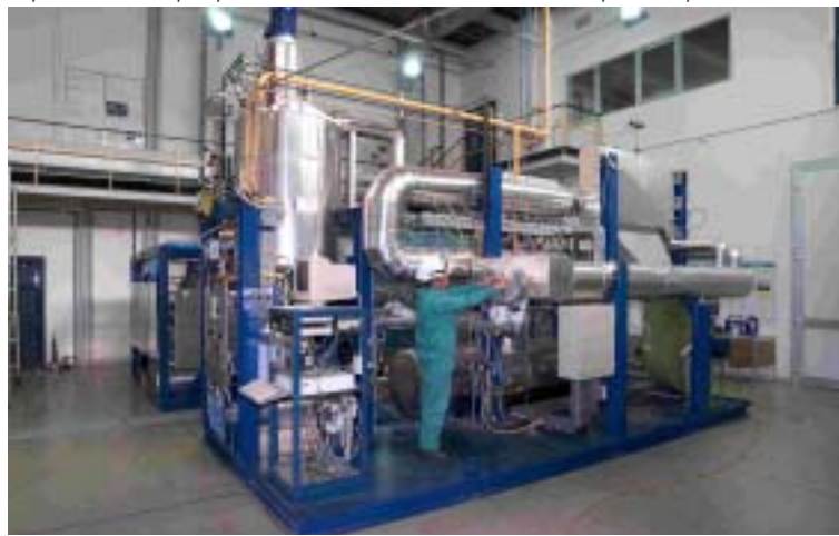
Impianto LECOR per prove di corrosione su materiali e componenti per reattori ADS

A supporto del Progetto Solare Termodinamico, finalizzato allo sviluppo di sistemi solari a concentrazione, sono state avviate attività sperimentali con lo scopo di determinare e quantificare i fenomeni di corrosione e ossidazione che hanno luogo sulla superficie dei materiali esposti a sali fusi inorganici e gli eventuali effetti che si possono determinare nelle zone termicamente alterate da saldatura, attraverso diversi tipi di analisi.