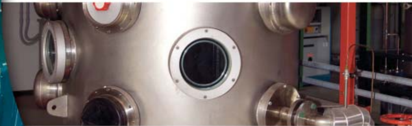
Impianto THESIS per prove di termoidraulica di blanket raffreddati ad acqua per il progetto ITER

Presso il Centro, in cui operano circa 130 dipendenti, è in funzione un Centro Informazione aperto al pubblico, che svolge attività di informazione e formazione su tematiche energetiche ed ambientali.