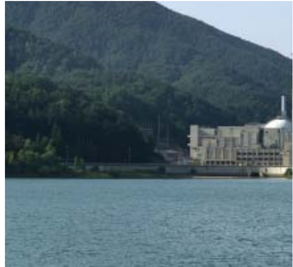
Veduta del Centro Ricerche ENEA Brasimone

Il Centro Ricerche ENEA Brasimone, situato sull'Appennino tosco-emiliano sulle rive del Bacino Brasimone nel Comune di Camugnano (Bologna), è sorto negli anni 60 con lo scopo di effettuare studi per lo sviluppo della filiera europea di reattori nucleari a neutroni veloci.