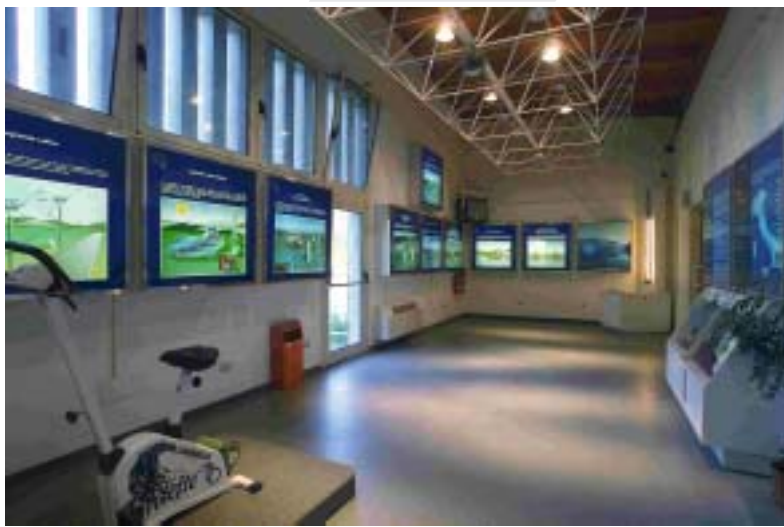
Sala espositiva del Centro Informazione