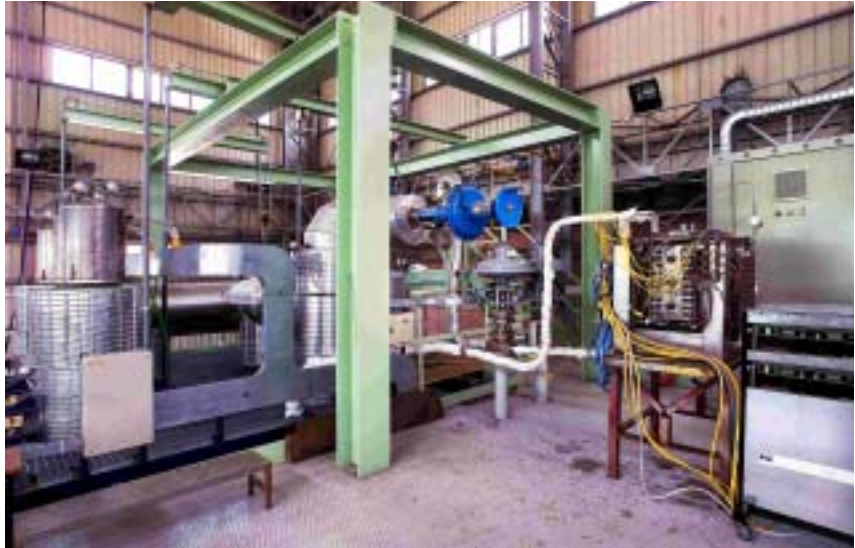
Impianto HE - FUS3 per la caratterizzazione di blanket raffreddati a elio per il progetto DEMO

Le attività nell'ambito del Progetto ITER includono: