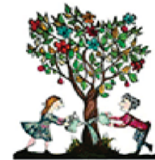
Premio SODALITAS SOCIAL AWARD