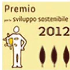
Premio Sviluppo Sostenibile 2012