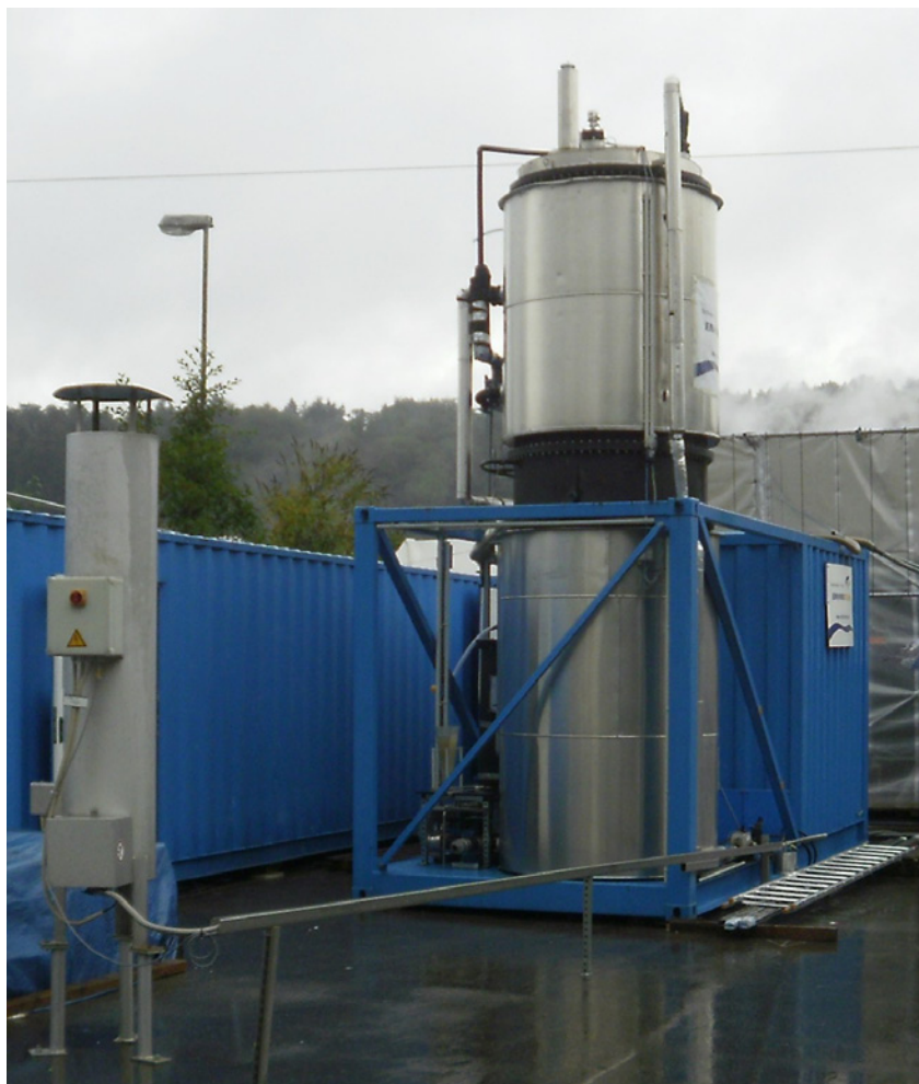
Fig. 4 Impianto di tipo UASB per il trattamento anaerobico con recupero di metano dai reflui di una cartiera tedesca, realizzato da Envirochemie nell'ambito del progetto europeo (7 th FP) Aquafit4use di cui ENEA è stata partner

Per saperne di più: alessandro.spagni@enea.it