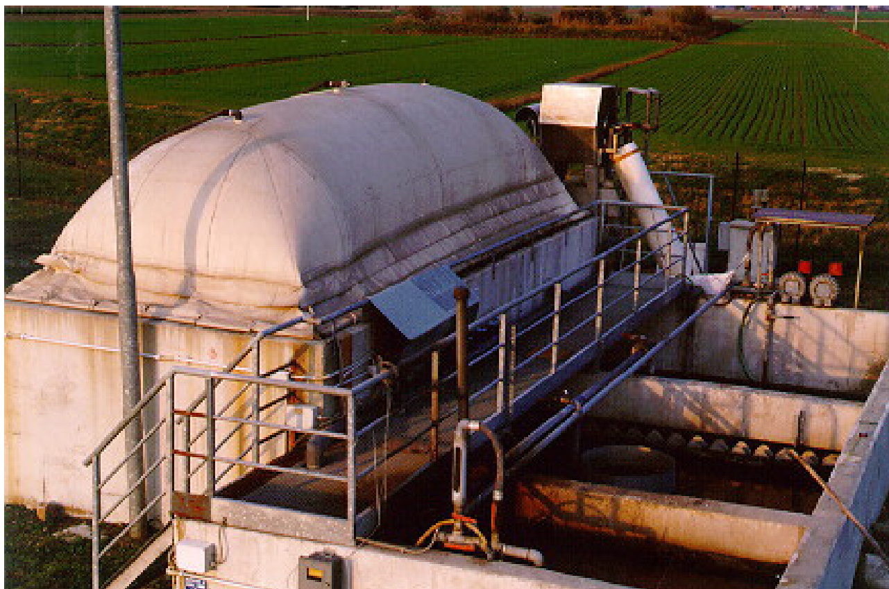
Fig. 3 Impianto di depurazione di Biancolina (Bologna); sulla sinistra il primo Anaerobic Baffled Reactor (ABR) in Italia per la digestione anaerobica del liquame progettato dall'ENEA

applicazioni in piena scala di quante riportate in letteratura.