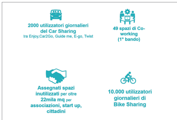
Fig. 2 Milano Smart City. Alcuni numeri della sharing economy

Efficienza energetica e qualità dell'ambiente domestico sono i principi guida dell'intervento realizzato su un complesso di edifici pubblici e privati, un distretto smart a energia quasi zero che vedrà lo sviluppo di sistemi di ge-