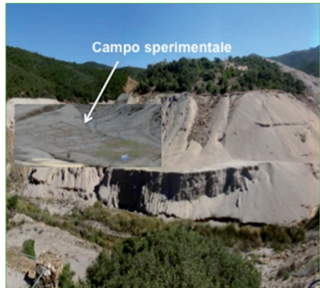
Figura 2 Campo sperimentale di fitorisanamento assistito da microrganismi, allestito nel sito minerario di Ingurtosu (Cagliari), in località Valle degli Sterili

Per i siti minerari, nell'ambito del progetto UMBRELLA (UE-FP7- 226870), è stato sviluppato un approccio integrato per il risanamento del suolo attraverso processi bio-geologici, applicando il fitorisanamento assistito da microrganismi, per la regolazione della mobilità dei metalli su scala di ecosistema. Lo studio ha riguardato sei siti minerari per stabilire misure migliorative, economicamente efficienti e sostenibili, per la bonifica da metalli pesanti, in diverse regioni geografiche e climatiche d'Europa, su larga scala. L'obiettivo del progetto, quello di utilizzare il potenziale offerto dai microrganismi nativi per accelerare le attuali tecniche di fitorisanamento, è stato perseguito con un approccio di ricerca interdisciplinare nei settori della microbiologia, della fisiologia vegetale e della (idro)-geochimica, mirato allo studio