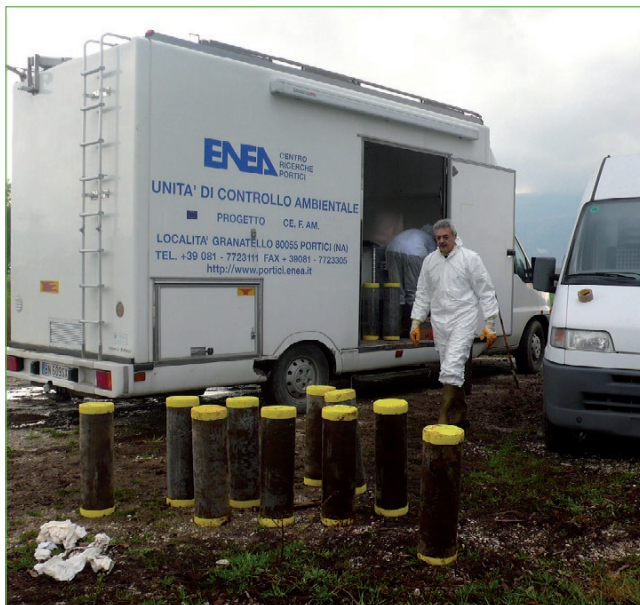
Figura 1 Prelievo in campo di carote indisturbate di suolo (ASTM Standard Guide)

Queste misure devono essere compatibili con la conservazione della qualità del suolo e, quindi, delle sue funzioni.